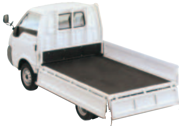
マツダ ポンゴ (荷台)