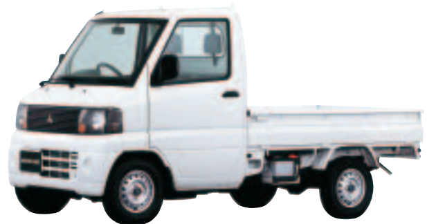
ミニキャブトラック