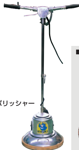
タフポリッシャー