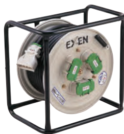
コードリール 商品コード Z03022