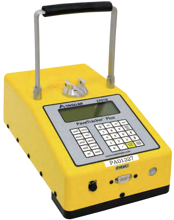
充電式 ペイブトラッカー Plus