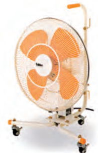
キャスター 工場扇 SKF-45CD