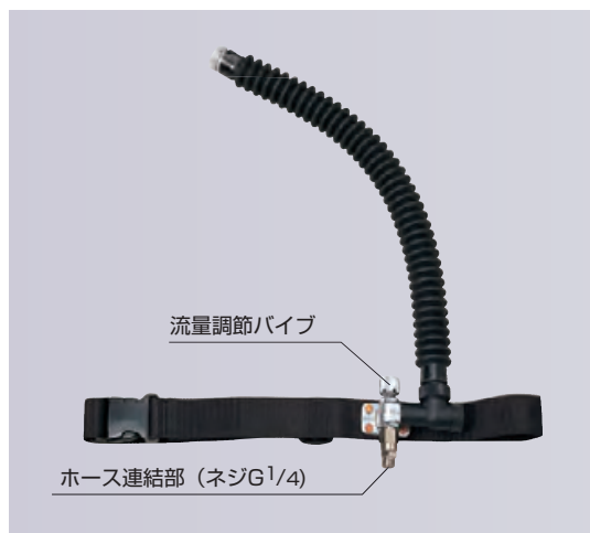
エアラインマスク AL-4N