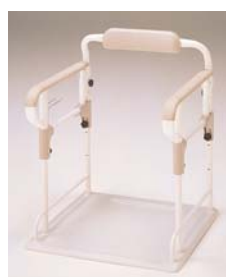
安寿ポータブルトイレ用 フレームささえ