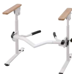
洋式トイレ用フレームS 跳ね上げR