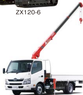
クレーン付トラック