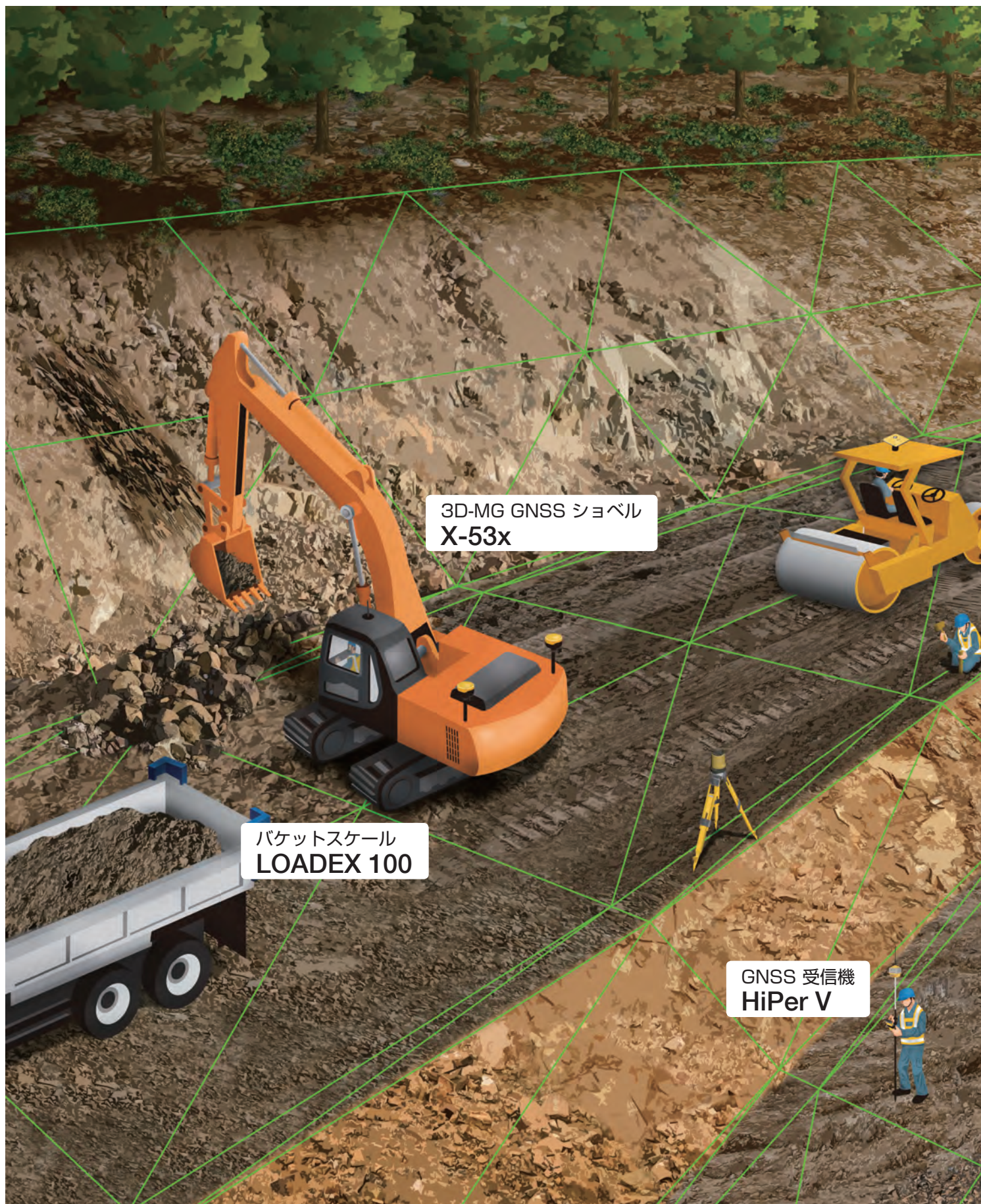
3D-MG GNSS ショベル X-53x

i-Constructionでは、GNSS測量機やトータルステーションによる位置情報から建機のブレードやバケット位置を算出し、3次元設計面とリアルタイムに比較できるICT建機を用いて施工します。