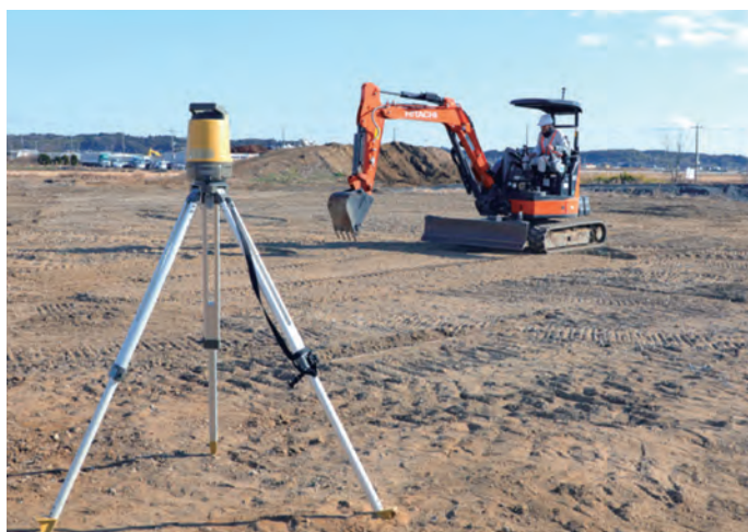
3D-MG LPS ショベル X-M3x LN