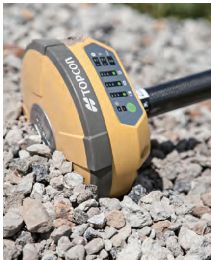
HiPer V 2周波GNSS受信機