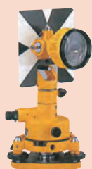
チルトプリズム ユニット