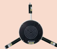
大口径用ターゲット