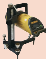
トリベットスタンド