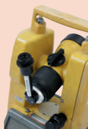
ダイアゴナル アイピース