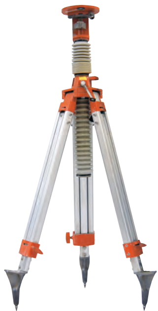
エレベーター三脚