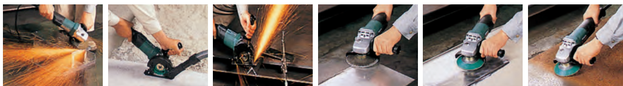
レジンイドフレキシブルディスクによる研削作業 ダイヤモンドホイールによるコンクリートへの溝入れ作業 切断トインによるアングル切断作業 多羽根ディスクによる溶接ビード面仕上げ作業 スーパーワイヤブラシによる塗装はがし作業 スーパーワイヤブラシによるサビ落とし作業

〈作業例〉先端工具を取替えることにより、様々な作業に使用できます。（刃物は販売にて取扱っております。）